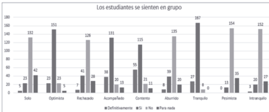
Figura 2. Resultados obtenidos de las universidades públicas y privada de mayor población estudiantil