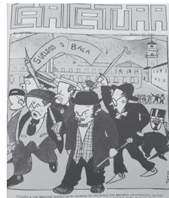
Figura 2. Portada Revista Caricatura.