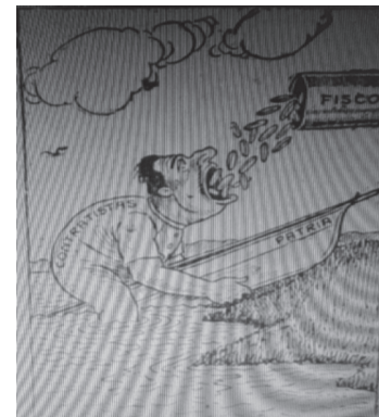
Figura 3. Fisco.