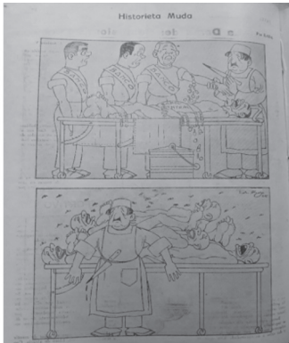
Figura 4. Historieta muda. Tomado de: Revista Savia, (octubre de 1925, p.16).