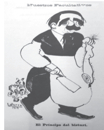
Figura 1. El Príncipe del bisturí.

La intención política e ideológica de las caricaturas seleccionadas recurre a la persuasión de las audiencias mientras hacen reír y pensar, es una de las estrategias