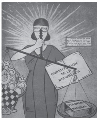
Figura 6. Portada Revista Cocoricó.

que saltan a la vista, máxime si se trata de imágenes de políticos, de gobiernos en crisis o problemáticas sociales y económicas.